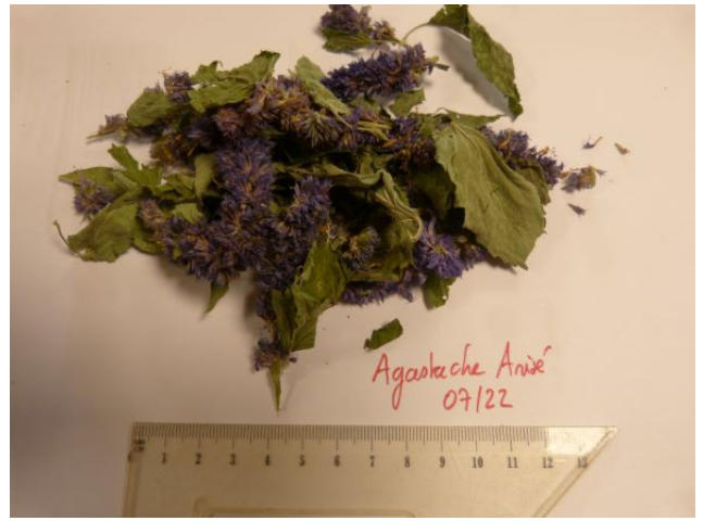
Agastache Anise 07/22